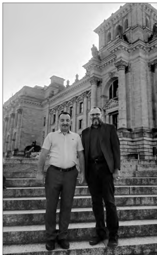
На знімку: під час семінару в Німеччині.