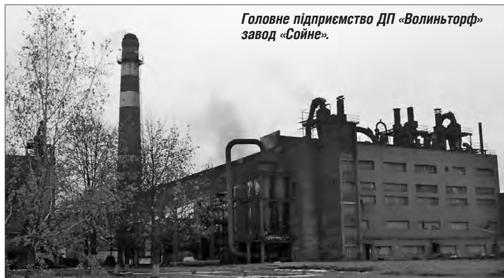
Головне підприємство ДП «Волиньторф» завод «Сойне».