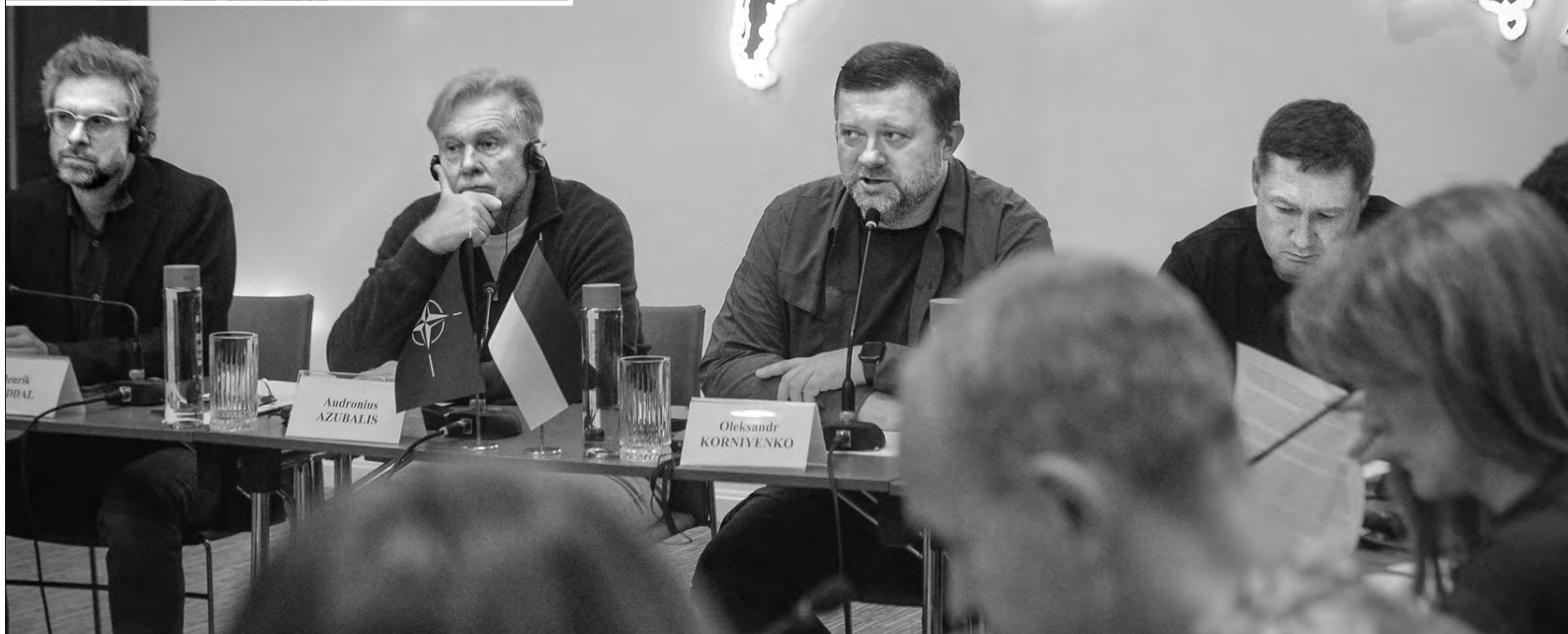
Більше фото тут — www.golos.com.ua

Перший заступник Голови Верховної Ради України, співголова Міжпарламентської ради Україна—НАТО (UNIC) Олександр Корнієнко взяв участь у засіданні цієї організації, що відбулось у Львові.