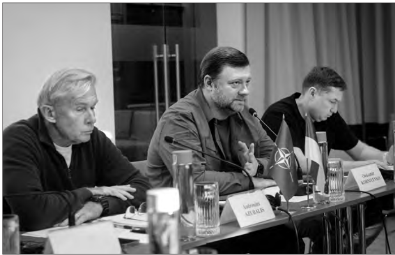
Під час засідання.

Він зазначив, що постійні ракетні обстріли з боку росії про-